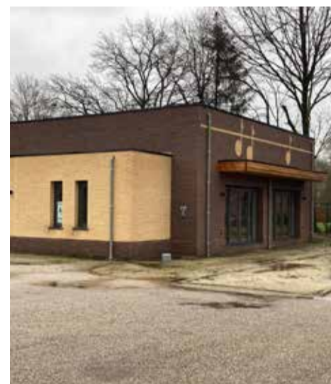
Het nieuwe lokaal van de fanfare.

Literdozen en lijstaarten in smaken naar keuze op bestelling